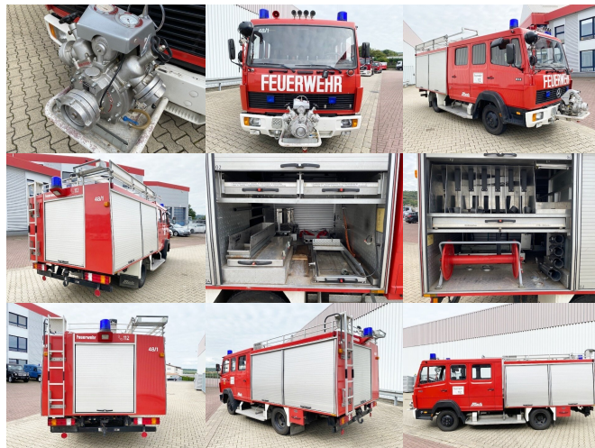
DAIMLER-BENZ LK 814 4x2, Löschfahrzeug LF8