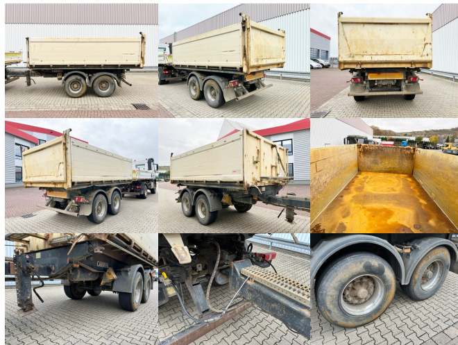
CARNEHL CTK/A, Alu-Bordwände, ca. 14,5m 3

Preis(brutto): 14.161,00 € gesetzl. MwSt.19%: 2.261,00 €