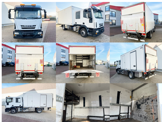
IVECO(I) EuroCargo 120E25 4x2 Doka mit 1000kg LBW