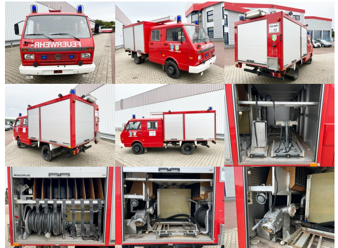
VW VW LT 50 D 4x2 Doka

Preis(brutto): 11.781,00 € gesetzl. MwSt.19%: 1.881,00 €