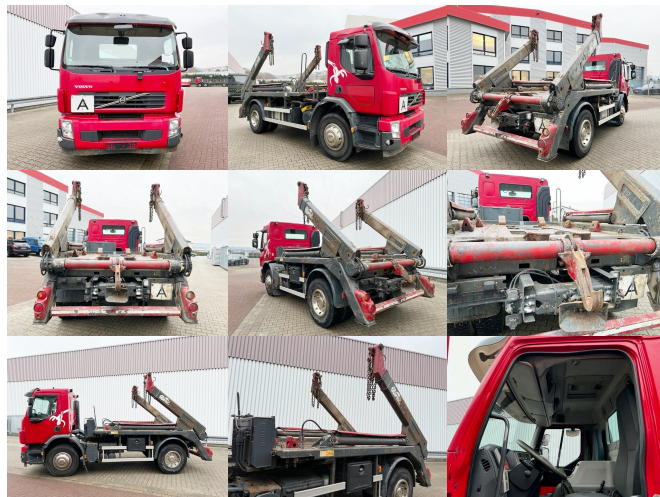
VOLVO (S) FE-230 4x2