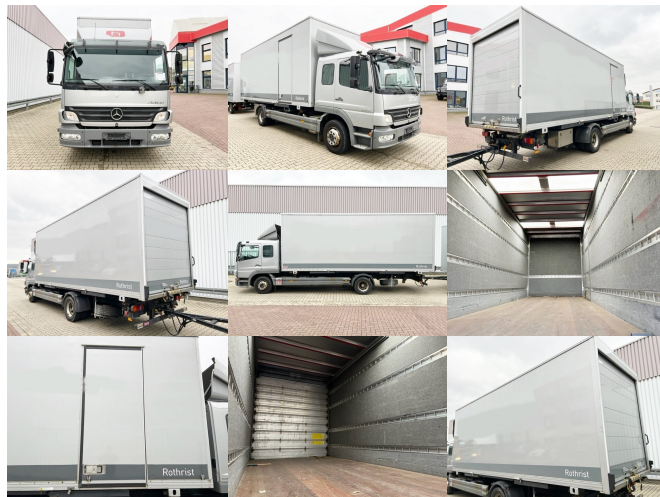
DAIMLER-BENZ Atego 1229 L 4x2