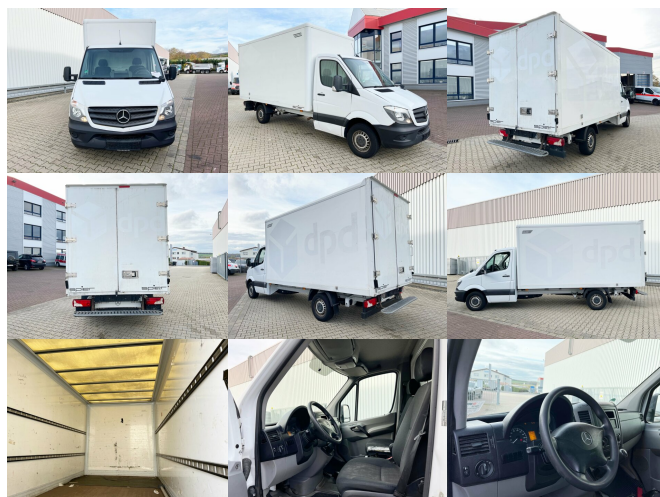
DAIMLER-BENZ Sprinter 313 CDI 4x2, 5x Vorhanden!

Preis(brutto): 22.015,00 € gesetzl. MwSt.19%: 3.515,00 €