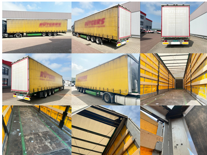
KRONE SDP 27 eLCUQ-CS, Coilmulde, Edscha-Verdeck, Hubdach, ca. 93m 3

Preis(brutto): 9.401,00 € gesetzl. MwSt.19%: 1.501,00 €